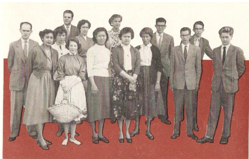
INTRODUCTIE NIEUWE BEAMBTEN TEN HOOFDKANTORE OP 1 AUGUSTUS 1956