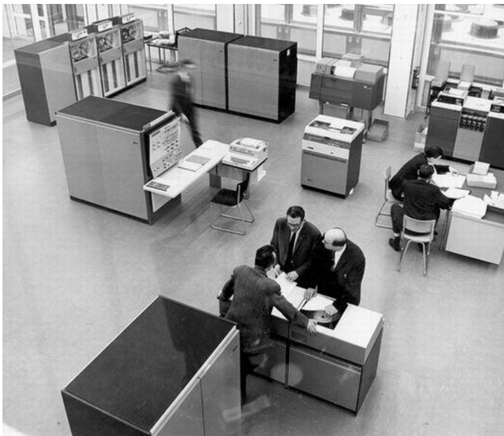
Schiekade 1966 met 360/40

Toen ik in 1990 in het kantoor aan de Schiekade kwam, was daar het grootste rekencentrum met AS/400 in Europa gevestigd. In de ruimte die het AC in 1972 verlaten had (zie de vorige bijdrage van Hillard).