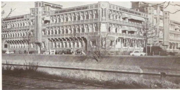
Het Haagse kantoor van Nationale-Nederlanden aan de Groenhovenstraat.