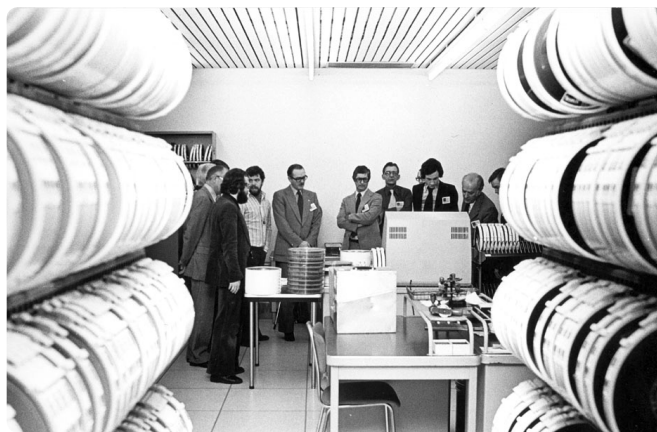
De Computerzaal met magneetbanden op de voorgrond, 1977